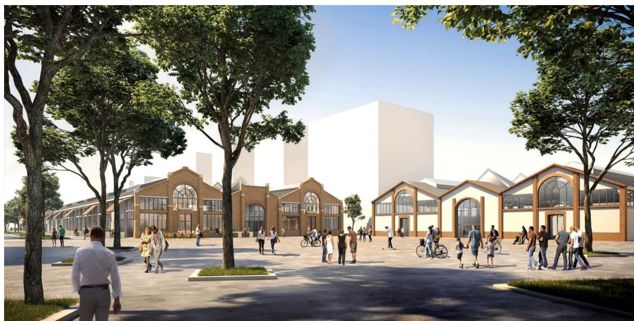
© Chloe Bodart - Construire_Oeco architectes

D'un point de vue architectural, l'enjeu majeur de cette opération de réhabilitation a été d'adapter le programme aux caractéristiques des Halles existantes en préservant leurs essence et caractère, tout en créant de nouveaux espaces et en mettant en valeur le patrimoine architectural industriel.